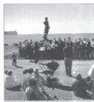
Above, one from Salt Lake as a pioneer in the past of the 'Massachusetts to the Kingdom.' Below, the site of the 'Cave of the Saints' in Iceland at present time.