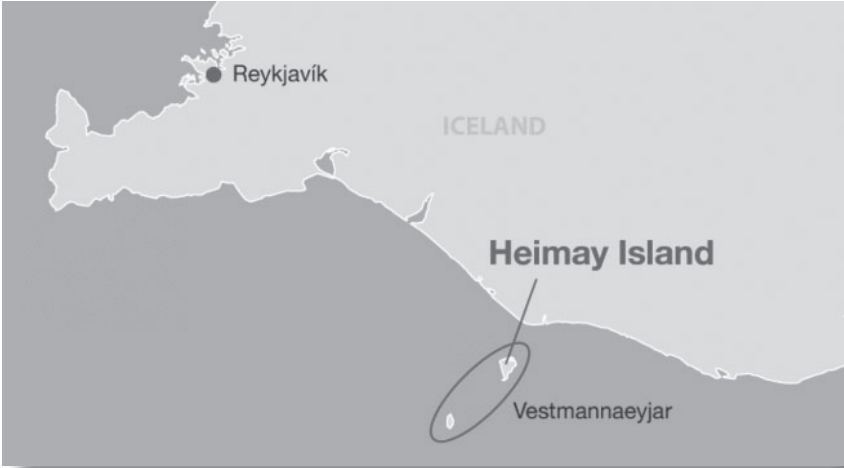
Map showing the location of Vestmannaeyjar, Iceland.