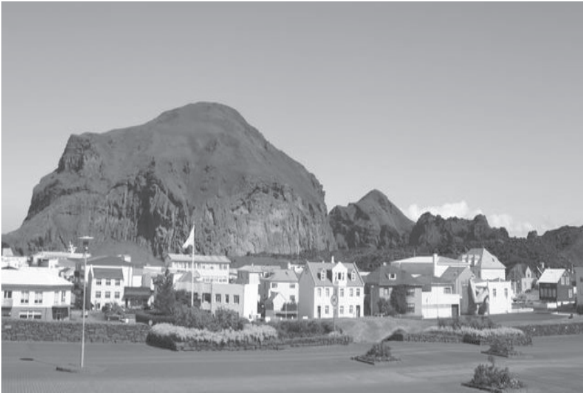
Vestmannaeyjar, Iceland, location of the new museum exhibit focusing on early Latter-day Saints who emigrated from Iceland to Utah.