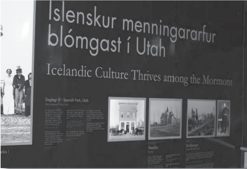
The museum exhibit in Vestmannaeyjar, Iceland, tells the story of Icelanders who joined The Church of Jesus Christ of Latter-day Saints and emigrated to Utah between 1854 and 1914.