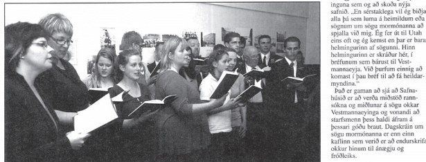
MORMÓNAKÓR frá Reykjavík og Seífassi sá um allan söngflutning.