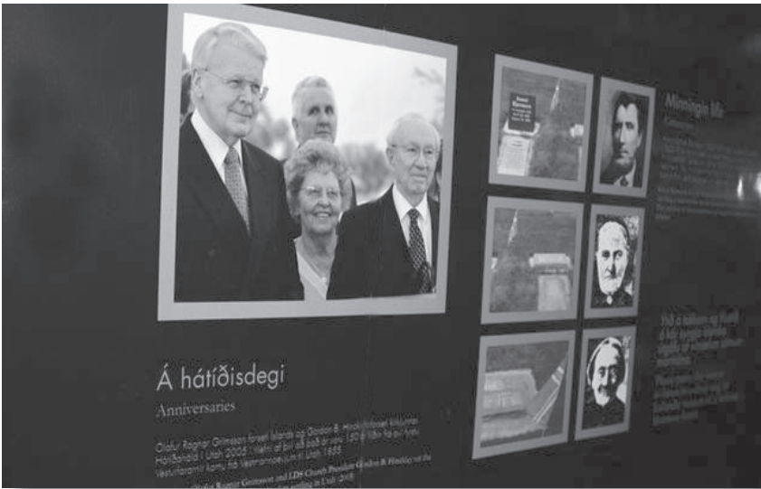
The museum exhibit in Vestmannaeyjar, Iceland, explores the connection between Iceland and the Latter-day Saints. Pictured here is a 2005 visit of Iceland president Ólafur Ragnar Grímsson during a visit to Utah. LDS Church President Gordon B. Hinckley is pictured to the right.